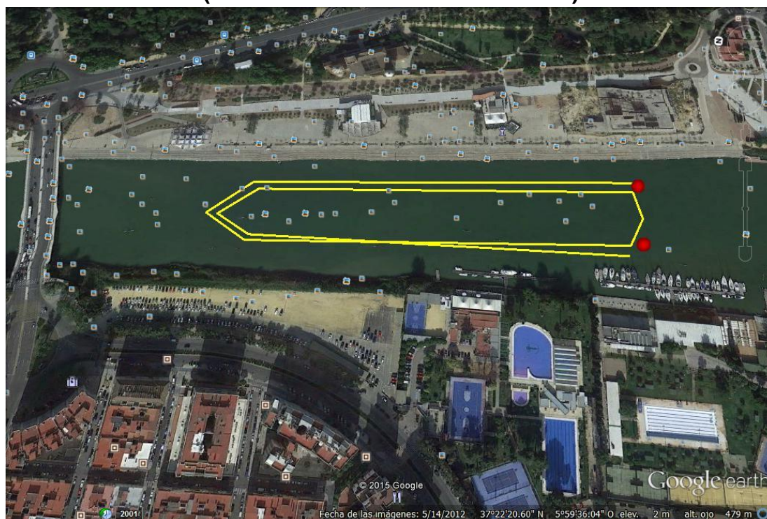
Recorrido 750m y 1500m (1 y 2 vueltas a un recorrido de 750m)