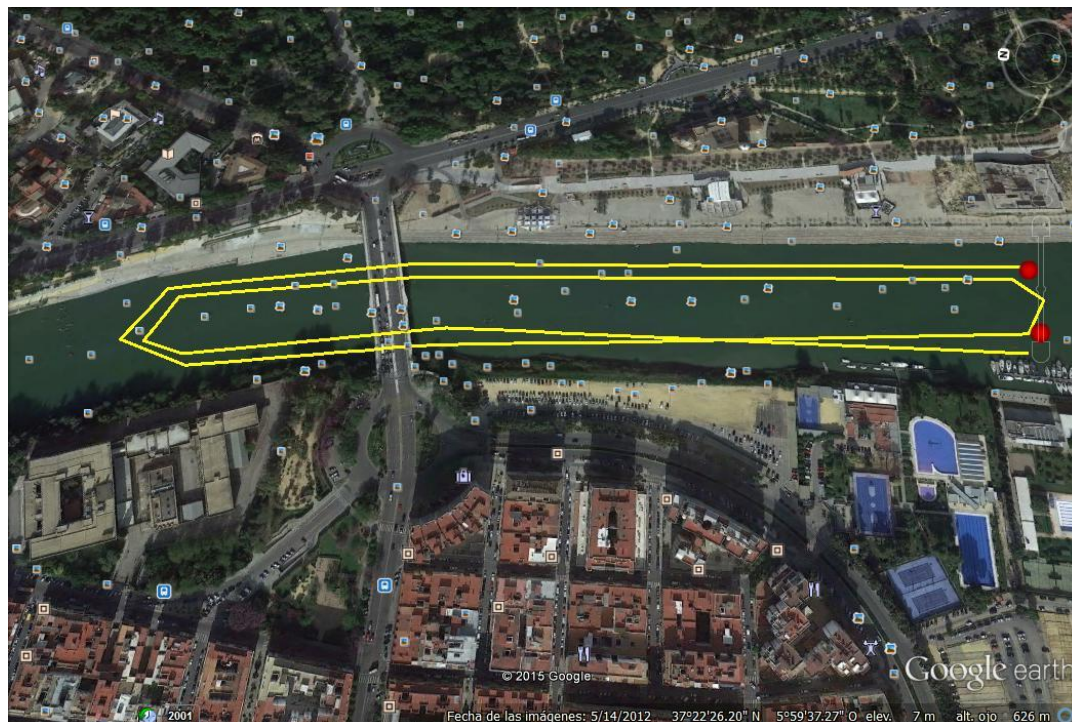
Recorrido 3000m (2 vueltas a un recorrido de 1500m)