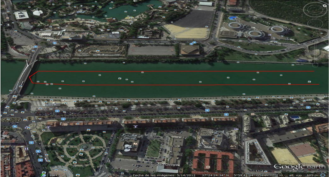
Alevines, Benjamín y PreBenjamin (1 Vuelta de 1500m) Infantiles (2 vueltas de 1500m).