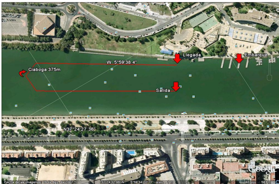
Benjamins, Alevin N y C1 Alevin (1 Vuelta de 750m)