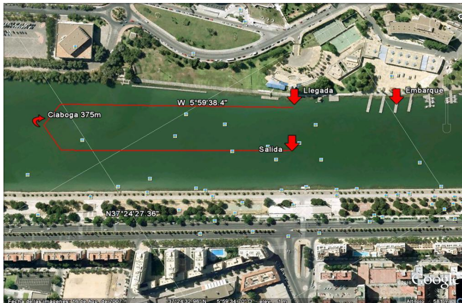
Benjamines (1 Vuelta de 750m)