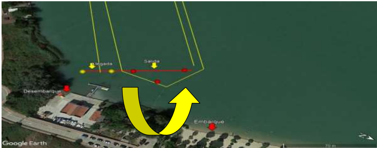
Croquis Salida, Llegada, Ciaboga.