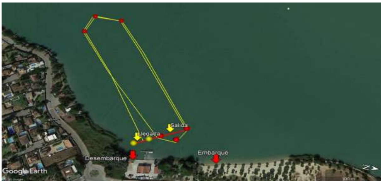
Recorrido 1500m: 2 vueltas a un circuito de 750m Recorrido 750m: 1 vuelta a un circuito de 750m