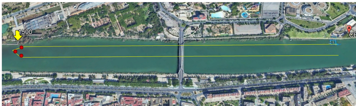
Recorrido 3000m: 1 vuelta de 3000m