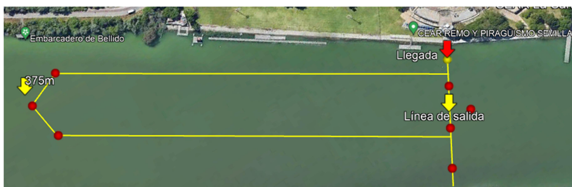
Recorridos 750m (1 vuelta de 750m) y 1500m (2 vueltas de 750m)