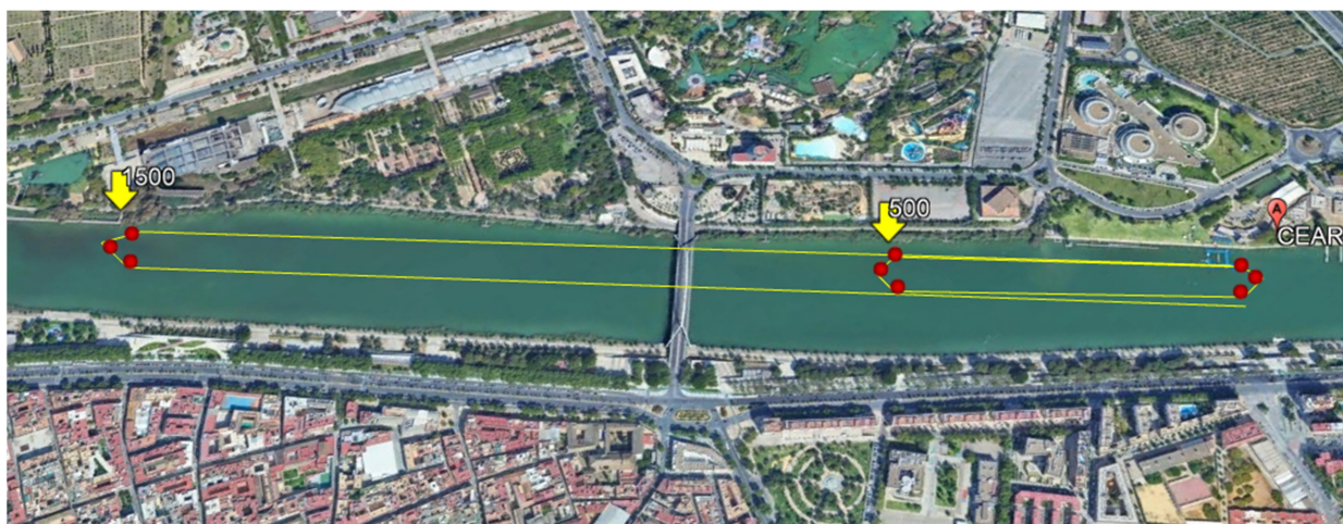
Recorrido 5000m: 1 vuelta a un circuito 3000m y 2 vueltas de 1000m

Zona Calentamiento: Todos los deportistas deben realizar el calentamiento hacia la izquierda del C.E.A.R., sin invadir en ningún momento el campo de regatas ni sobrepasar la zona de pantalanes.