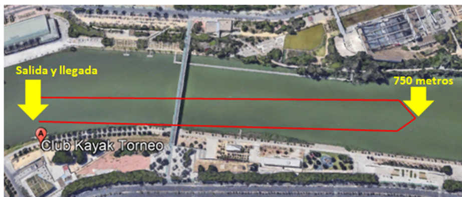
Croquis del Recorrido de los Alevines Kayak