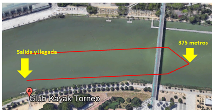
Croquis del Recorrido de los Alevines Canoa, Benjamines y Prebenjamines